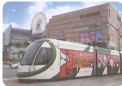
高雄輕軌行經C5夢時代站