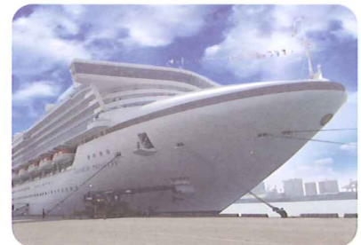
公主郵輪灣靠高雄港9號碼頭